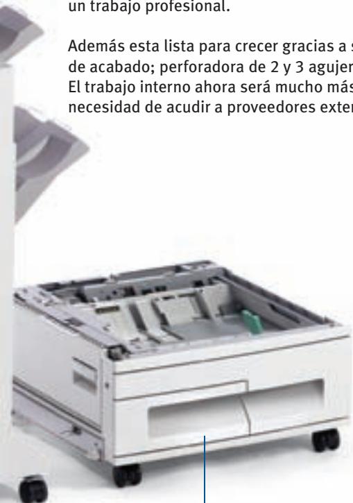
Bandeja doble opcional para 2,000 hojas tamaño Carta/A4

Calidad, rendimiento, eficiencia y soporte: prueba de que la Serie B930 de OKI Printing Solutions es la respuesta a sus necesidades de impresión de alta productividad.