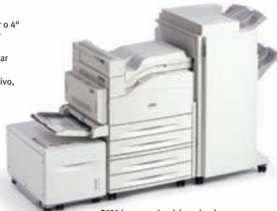
B930dn con una bandeja opcional Tabloide/A3 para 1,000 hojas, alimentador de alta capacidad para 2,000 hojas y terminador/apilador